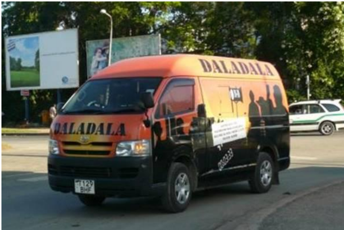
Daladala camioneta en Tanzania

Twaweza también trabaja con organizaciones que utilizan a los medios y teléfonos celulares para ayudar a los ciudadanos a convertirse en agentes de cambio. Daraja , por ejemplo, una organización que trabaja en zonas rurales en Tanzania, trabaja para hacer que el gobierno sea más responsable respecto al acceso y mantenimiento de tomas de agua. Como parte del proyecto "Raising the Water Pressure" los ciudadanos envían mensajes de texto usando sus teléfonos celulares para reportar fugas de agua o problemas de acceso al agua en su comunidad. Los mensajes de texto se filtran a otras estaciones de radio que luego entrevistan a quienes enviaron el mensaje o reportaron el problema. La exposición pública de fugas de agua por todo el país puede presionar al Ministro de Agua para invertir en donde más se necesita y exigir rendición de cuentas de los servicios públicos de reparación de servicios de agua.